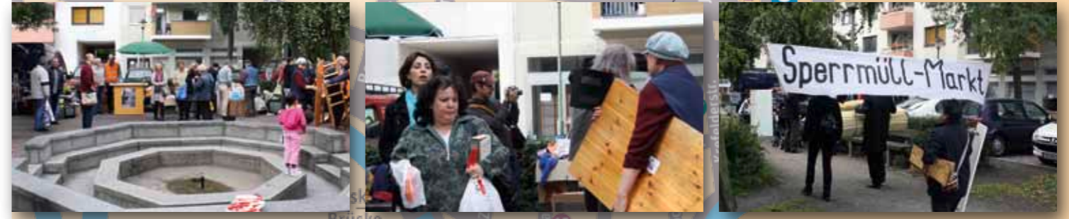
UNTEN: Eine wahre Fundgrube war wieder der Sperrmüllmarkt in der Waldstraße (2010)