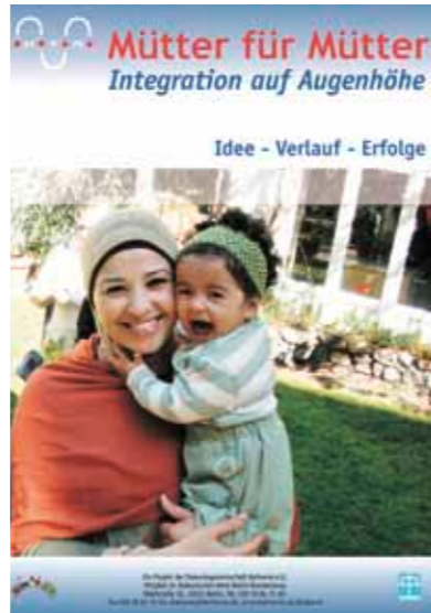
Projekt-Flyer von MüfüMü

Fattahy, haben sich für die Mitarbeit beworben. Eine Übertragung des Konzepts an Träger in anderen Berliner Stadtteilen ist angedacht. Leider ist die weitere Finanzierung von „Mütter für Mütter“ in Moabit nach Ablauf der Förderlaufzeit Ende 2011 aber immer noch offen. Eine Verstetigung dieses Erfolgsprojektes ist absolut wünschenswert. GB