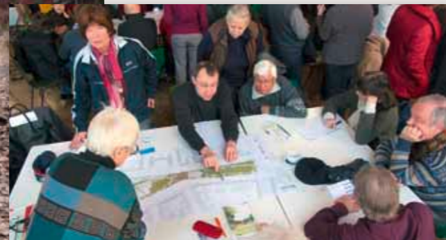
OBEEN LINKS: Der östliche Teil des Ottoparks soll sich zur Heilandskirche hin öffnen OBEEN RECHTS: Nur Hundehalter fühlen sich vom Ottopark eingeladen UNTEN LINKS: Zur „Holzpflege“ abgebaut: Bänke im Ottopark UNTEN MITTE: Erläuterung von Planungsdetails und UNTEN RECHTS: Regier Meinungsaustausch am Arbeitstisch bei der Planungswerkstatt