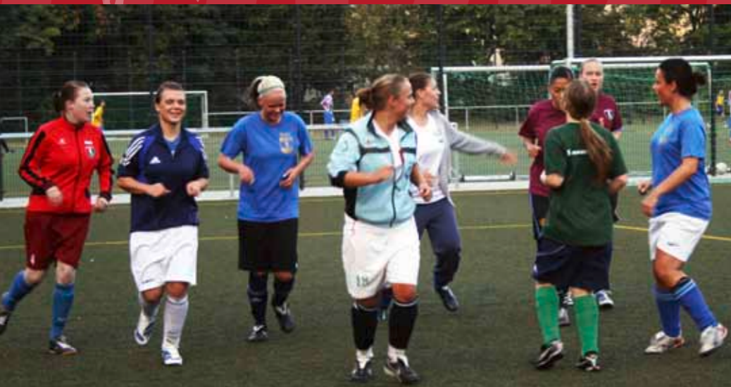
Warmlaufen der Frauen des Moabiter FSV Berlin 2010