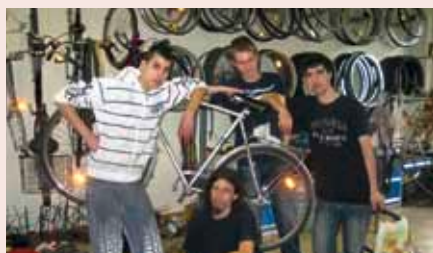
Mitarbeiter der Schülerfirma

Fachkundiger Rat spart Material und Geld. Beim Projekt FAHRbar des Moabiter Ratschlags e.V. kann man kostenlos die Sicherheit und Fahrtüchtigkeit seines Fahrrads überprüfen lassen. Auch gebrauchte Teile stehen zur Verfügung. Zudem bietet die Abteilung „Fahrradwerkstatt“ der Schülerfirma der Heinrich-von-Stephan Oberschule Reparaturdienstleistungen an. Die Jugendlichen beherrschen