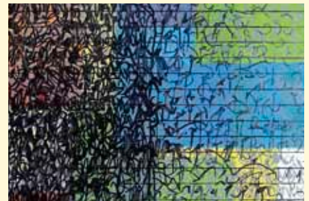
© Surachai Ekphalakorn, „Brush Rhythm“, 2010

- aus verschiedenen Workshops der Künstler mit Schülerinnen und Schülern des Moabiter Menzel-Gymnasiums. Thematischer Ausgangspunkt sind Muster, wie sie sich nicht nur in ästhetischen, sondern auch in kulturellen, historischen und sozialen Strukturen abbilden. Die Vielschichtigkeit des Themas greift „Pattern & Signs“ auf, in dem es interdisziplinäre Zugänge eröffnet und nicht nur im Bereich der bildenden Kunst, sondern ebenso in Musik, Soziologie und Naturwissenschaften auf Spurensuche geht. Somit werden kreative wie wissenschaftliche Arbeitsweisen verfolgt. Bei dem Projekt unter der Leitung von Dr. Claudia Beelitz kooperiert der Kunstverein