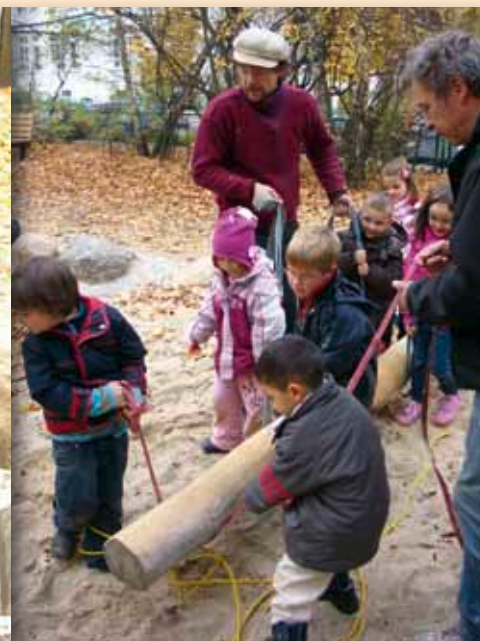
Der Weg ist das Ziel: Kinder der Kitas Arche Moabit und Huttenstraße 22a helfen bei der Gestaltung ihres Spielplatzes in der Reuchlinstraße UNTEN LINKS: Nun ist er fertig, der Spielplatz am Tag der Einweihung, 19. April 2011.