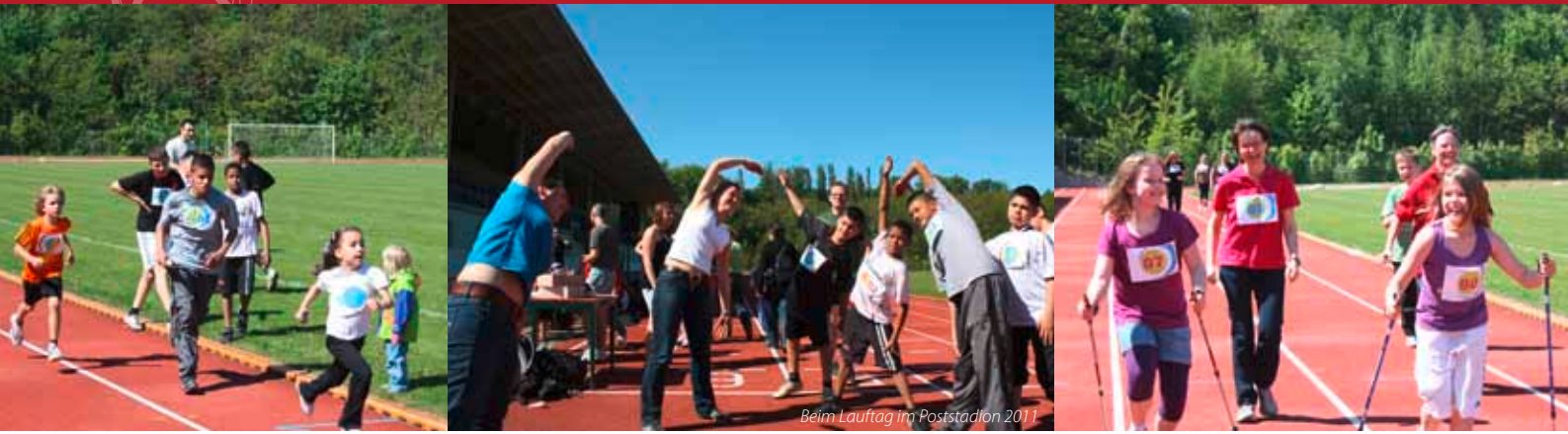
Beim Lauftag im Poststadion 2011