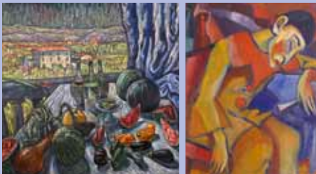
Abbildungsnachweise: LINKS: Theo von Brockhusen, Blick von der Villa Romana auf die Silhouette der Stadt Florenz, Öl auf Leinwand, 150x191 cm RECHTS: Paul Kother: "Clown", Öl auf Leinwand, 78x65 cm, um 1913