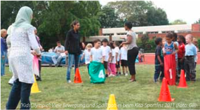
"KidsOlympic": Viele Bewegung und Spaß gab es beim Kita-Sportfest 2011