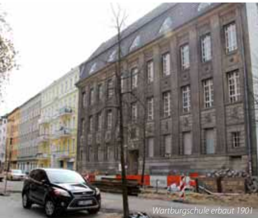
Wartburgschule erbaut 1901