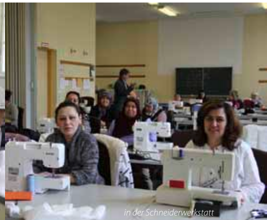
in der Schneiderwerkstatt